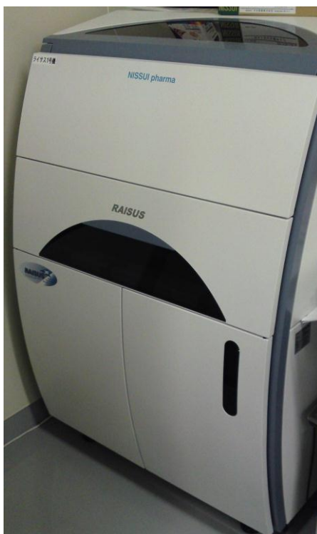
<細菌自動同定感受性機器>