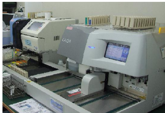
【全自動糖分析装置 GA09】