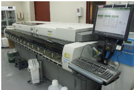
【化学自動分析装置 TBA-c16000】

院内測定検査全項目について 24 時間測定機器を稼働させ、昼夜を問わず迅速に対応しています。また、緊急検査項目については概ね 40 分程度で検査結果が得られます。