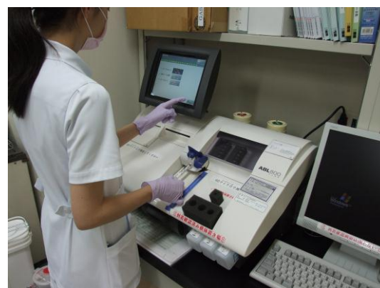
【血液分析システム ABL830】