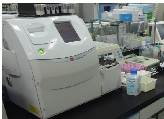
【全自動蛍光免疫測定装置 μTAS Wako i30】