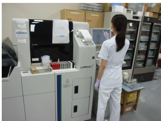
【全自動化学発光酵素免疫測定システム ルミパルス F】